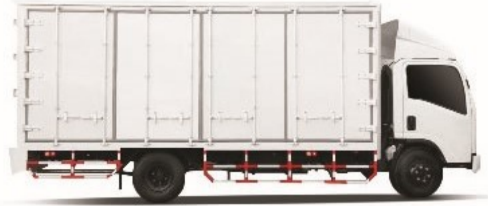
ขนาด 6 ล้อ