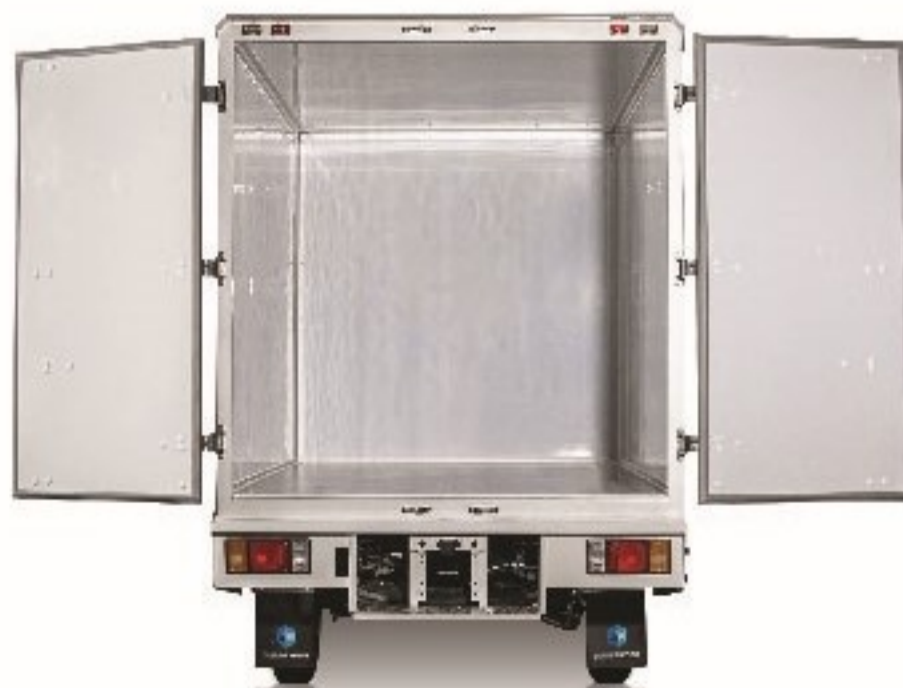
ขนาด 4 ล้อ