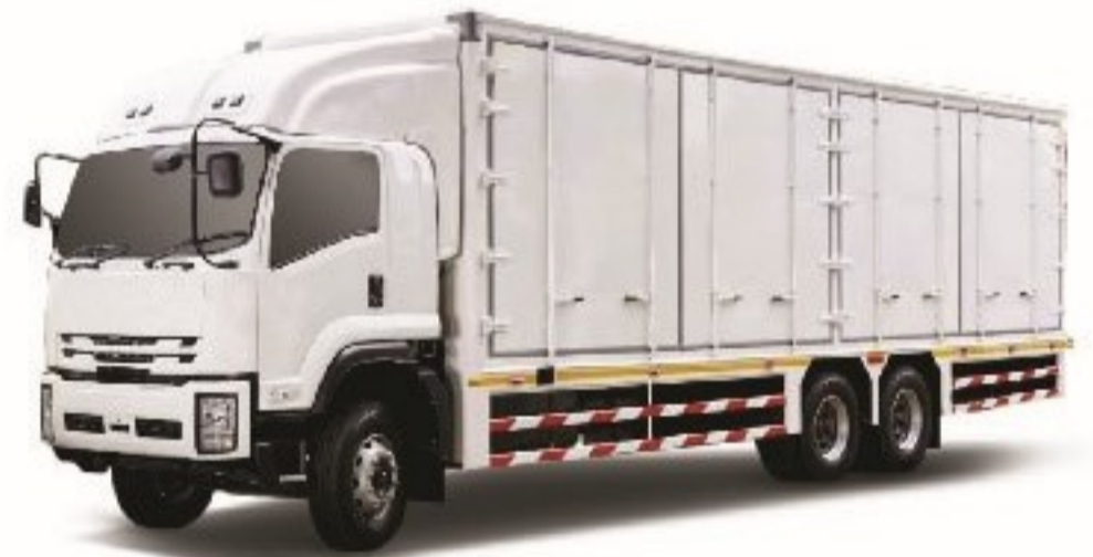
ขนาด 10 ล้อ