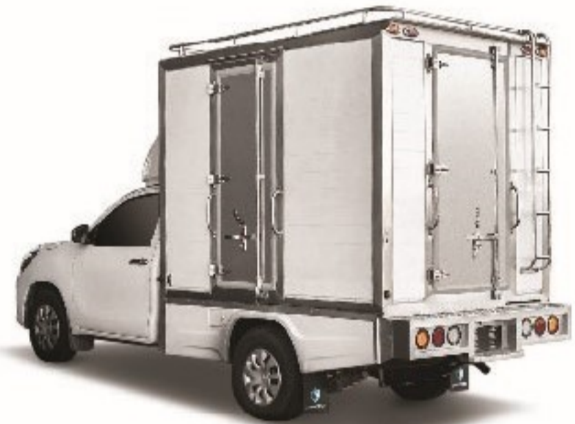
STRUCTURE ขนาด 4 ล้อ