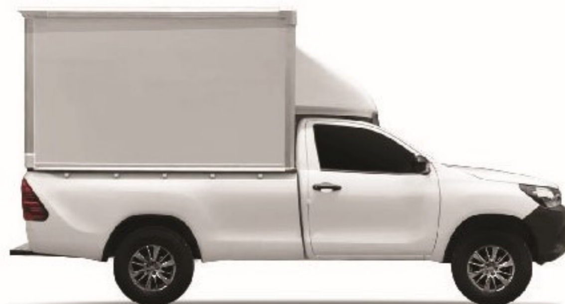
HALF RYDER ตู้ครึ่งใบ