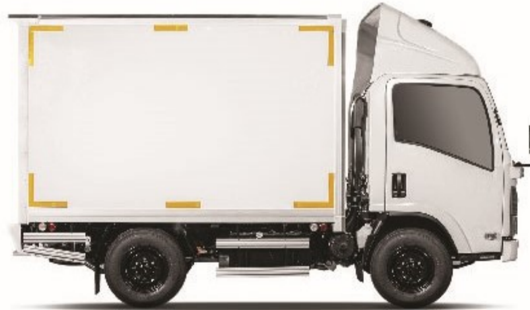
ขนาด 4 ล้อ